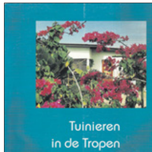
De eerste uitgave van Tuinieren in de Tropen is niet meer te koop.

Heb je een favoriete column? „Ja, de twee columns die ik