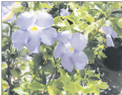
Deze prachtige klimplant kun je zelf stekken, maar denk erom dat je hem een plekje uit de wind geeft.