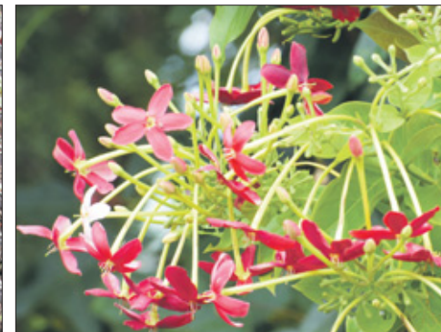
De Quisqualis indica is een wat onbekendere klimmer die het goed doet op Curaçao.