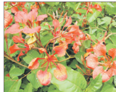
De orchideënbloem (Bauhinia) geeft schitterende bloemen en is zelfs te zaaien.

„Iedereen die me kent, weet dat blauw mijn favoriete kleur is. Dus toen ik tijdens een vakantie midden in Santo Domingo een lichtblauw bloeiende klimplant zag, wilde ik die meteen hebben. Helaas zag ik nergens zaden aan de plant, dus ik kon er niets mee. Tot ik de plant enkele maanden later in een Curaçaose tuin zag. Ik heb brutaalweg om stekken gevraagd en ook gekregen. Daarvan heeft er eenje wortel geschoten en die plant