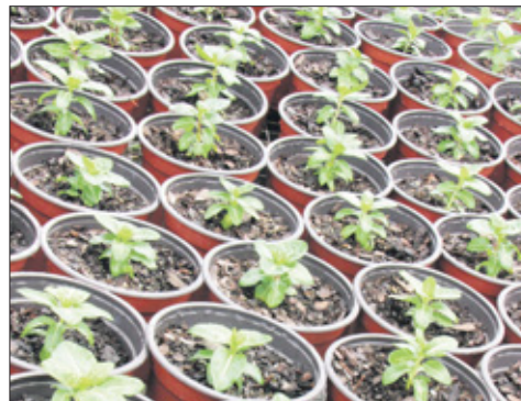
Magdaleentjes zaaien zich vanzelf uit.