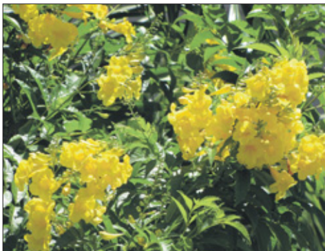
De kélkel hel of Tecoma stans is een ideale struik. Als hij eenmaal staat, hoeft hij hem eigenlijk nooit water te geven.

Wat maakt tuinieren zo leuk? „Je creëert iets. Je stemt kleuren op elkaar af, past de hoogte van struiken aan in de hoop op een mooi effect. Het betekent wel dat je altijd bezig blijft. Want het is best moeilijk om van tevoren te voorspellen hoe iets uitpakt. Over die fouten die ik zelf heb gemaakt, schrijf ik ook. Daar kan een ander weer van leren. Maar over het algemeen is tuinieren heel bevredigend, en vooral ook ontspannend werk. Je denkt even helemaal nergens aan. Een perfecte bezigheid dus om los te komen van de alledaagse sores.”