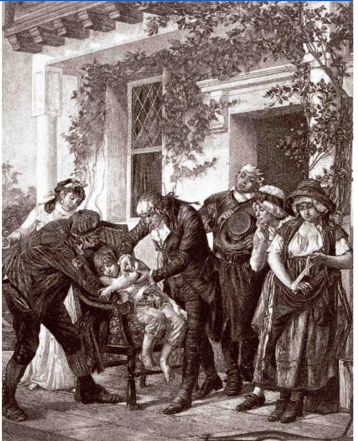
Edward Jenner (1749-1823) vaccineerde op de afbeelding uit 1796 de 8-jarige James Phipps met koepokken.

Om Curaçao beter te vrijwaren van de besmettelijke ziekte werd in 1916 wettelijk besloten dat alle schoolkinderen verplicht moesten zijn ingeënt. Daarmee werd de regeling gevolgd die in Nederland van kracht was. Ook het onderwijzend personeel diende aan te tonen dat het met goed gevolg de vaccinatie had ondergaan, dan wel de ziekte zelf had gehad – waardoor je immers immuun was. De bevolking kreeg tweemaal per jaar de gelegenheid zich kosteloos te laten vaccineren. De angst voor de ziekte zat er nog steeds goed in. De bemanning van op Curaçao arriverende schepen werd standaard door de havendokter onderzocht. In 1923 bleken twee bemanningsleden pokken onder de leden te hebben. Onmiddellijk werd het schip naar Caracasbaai in quarantaine gestuurd. Twee