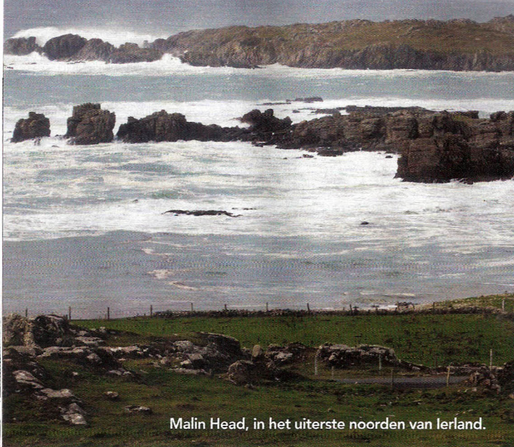
Malin Head, in het uiterste noorden van Ierland.