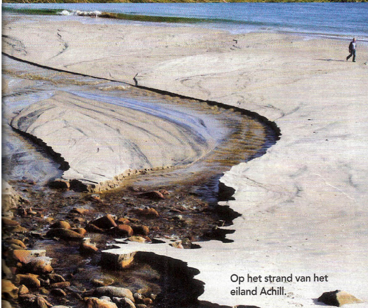
Op het strand van het eiland Achill.