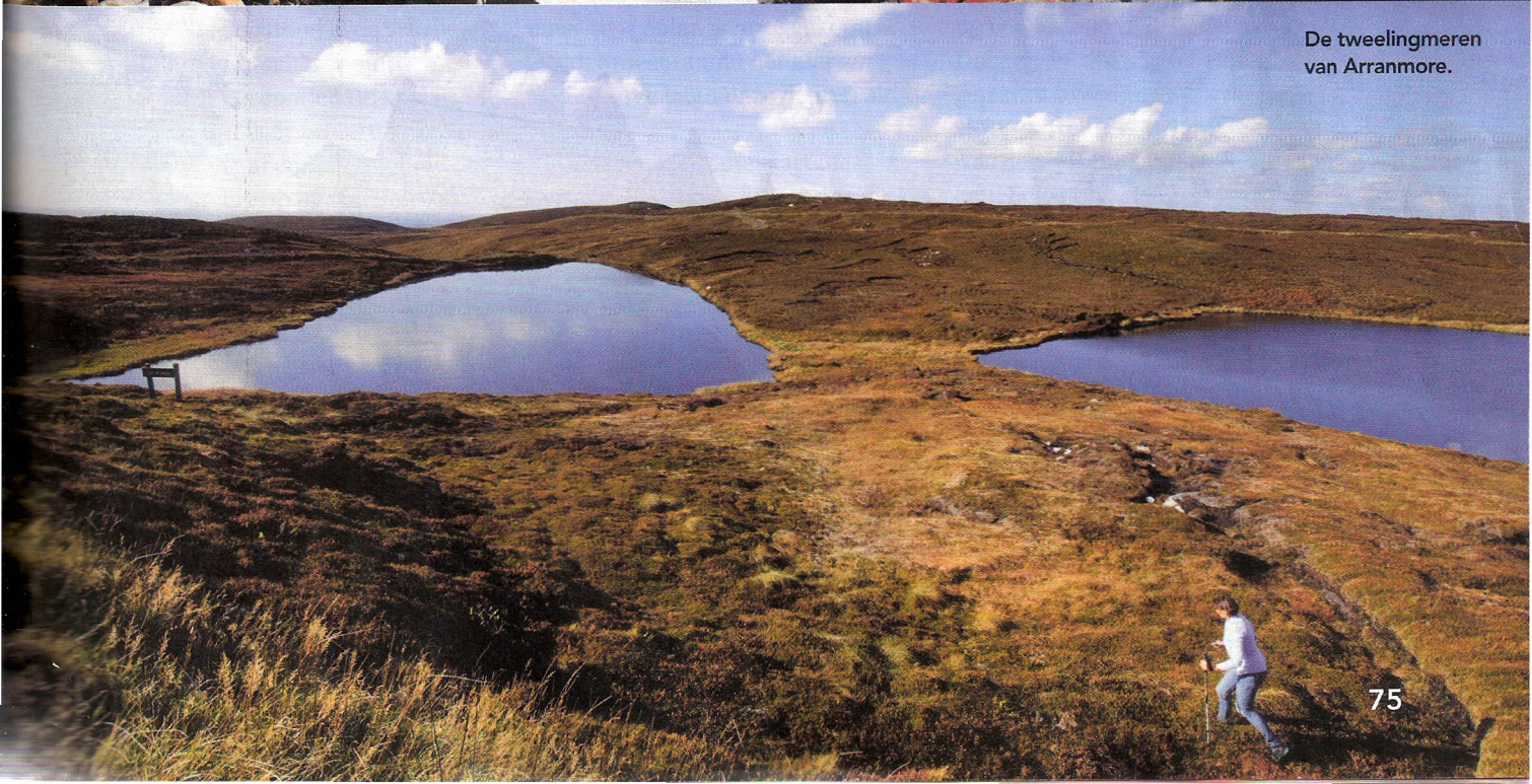
De tweelingmeren van Arranmore.