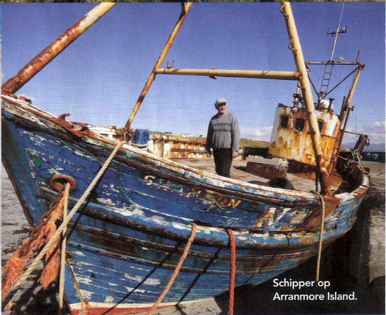
Schipper op Arranmore Island.