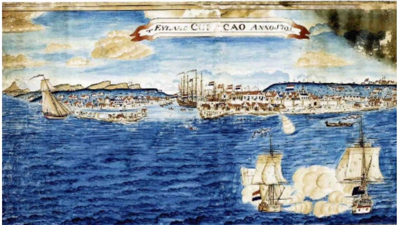
Kaart uit 1791 uit de Grote Atlas van de West-Indische Compagnie. Links op het Rif staat een vierkant gebouw. Dit is de Leprosie annex krankzinnigengesticht.

Capriles stelde al gauw vast dat Monte Christo 'geen bewaarplaats voor lyders aan zielsziekten' meer was. Inderdaad kregen sommige patiënten volgens het Koloniaal Verslag over 1883 een vorm van arbeidstherapie. Vooral de vrouwen, die bijvoorbeeld strohoeden maakten en dit zouden blijven doen tot in elk geval 1971.