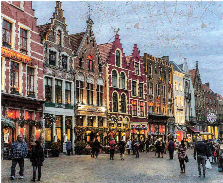
Gezelligheid op de Grote Markt in Brugge.