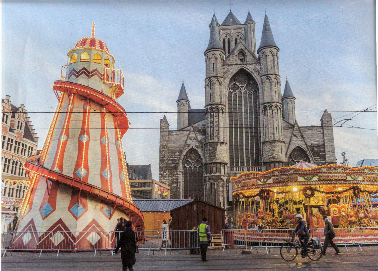
Boven: de kerstmarkt in Gent, voor de Sint-Niklaaskerk aan de Korenmarkt. Onder: Etablissement Max, ook in Gent, is beroemd om de warme wafels en andere lekkernijen. Rechts: voor chocolade in alle vormen en smaken ben je in Brugge op de juiste plek.